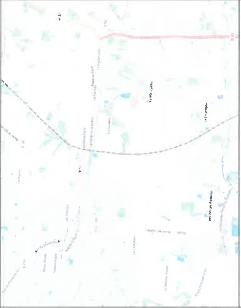
Planche N° 0

Commune : BOIS-DE-CENE Adresse : La Piltière Etude : 20230904T0215 Affaire Enedis : Non concerné Affaire Opérateur : Non concerné